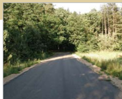
Ul. Krakowiańska w Żelechowie

Mamy w gminie jeszcze dużo do zrobienia w tej dziedzinie. Postęp jest jednak widoczny. Co roku można przeznaczyć więcej funduszy na budowę i modernizację dróg, wydłużają się więc odcinki płynnej jazdy. c.d na str.2