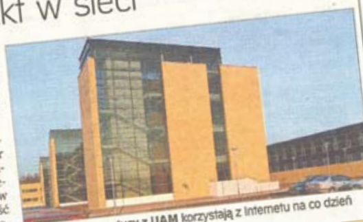
Młodzi informatycy z UAM korzystają z Internetu na co dzień

Co drugie gospodarstwo domowe w Poznaniu ma komputer z dostępem do Internetu – wynika z danych urzędu statystycznego. Wzrost liczby użytkowników sieci przekłada się na aktywność magistratu w tej dziedzinie. Coraz więcej spraw mieszkańcy mogą załatwić, nie wychodząc z