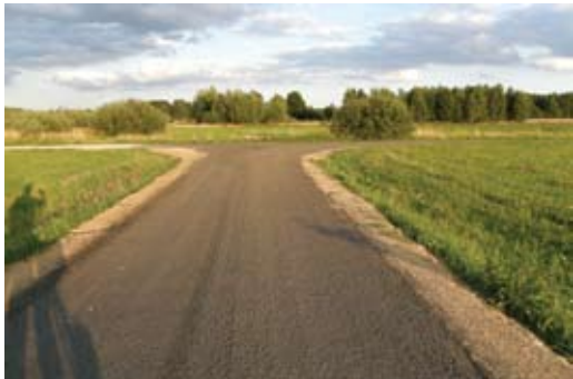
Droga w Pieńkach Zarębskich

Spróbujmy podsumować. W tym roku udało się zrealizować przebudowę drogi gminnej Kaleń- Pieńki Zarębskie i przebudowę drogi w Żelechowie.